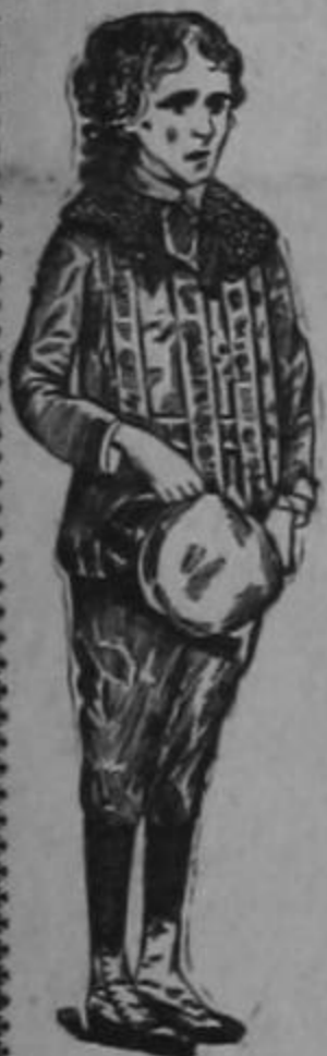
EDAD 9 AÑOS

La transformación maravillosa de un sér endeble y raquítico en un adolescente fuerte, robusto y sano, como lo demuestra su atlética figura, fué obra realizada por la